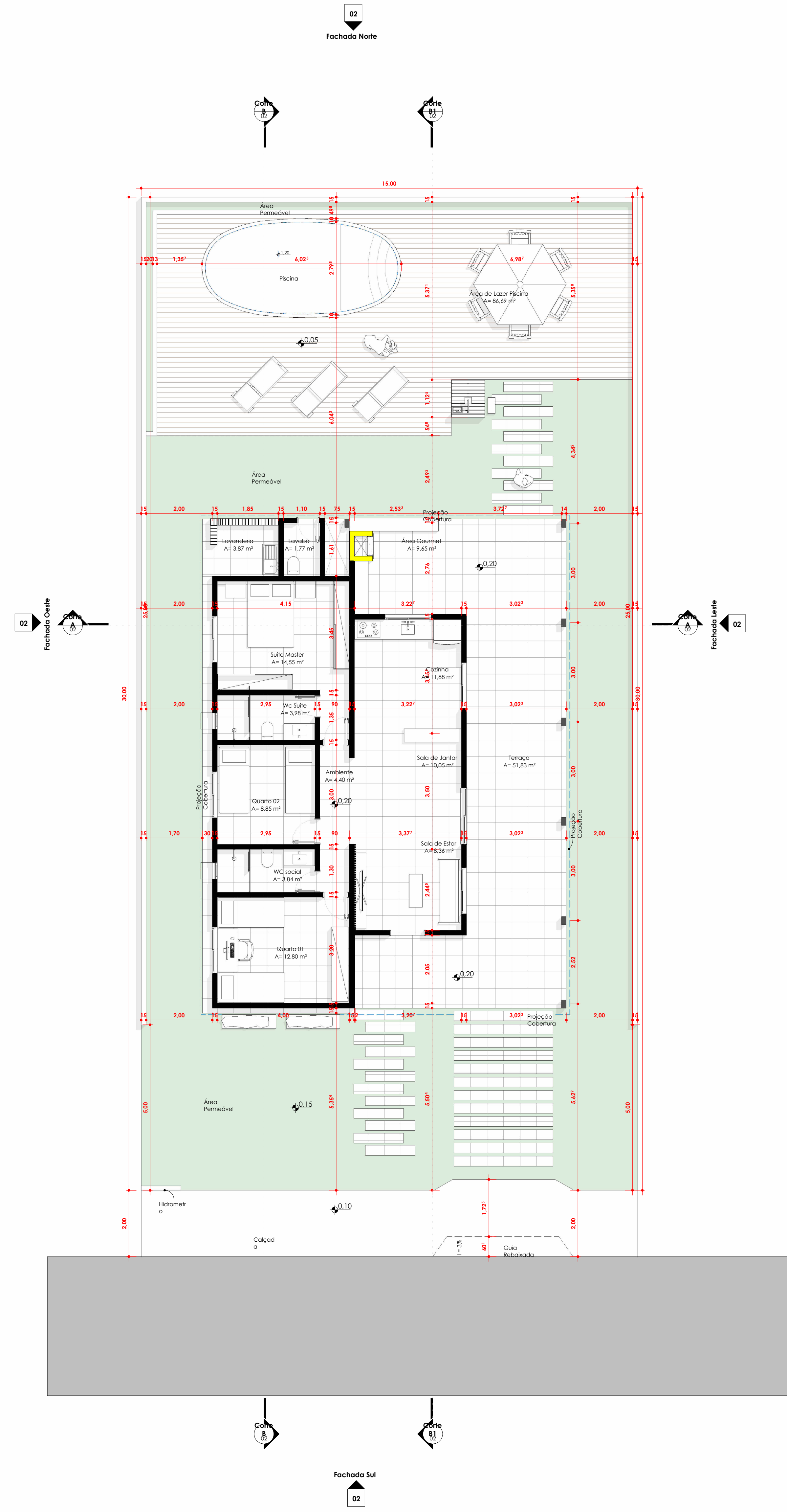
1 Planta Baixa - Térreo 1 : 75