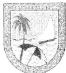
IMAGEM DO CADASTRO MERCANTIL