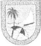
IMAGEM DO CADASTRO MERCANTIL