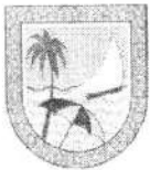
IMAGEM DO CADASTRO MERCANTIL