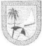
IMAGEM DO CADASTRO MERCANTIL