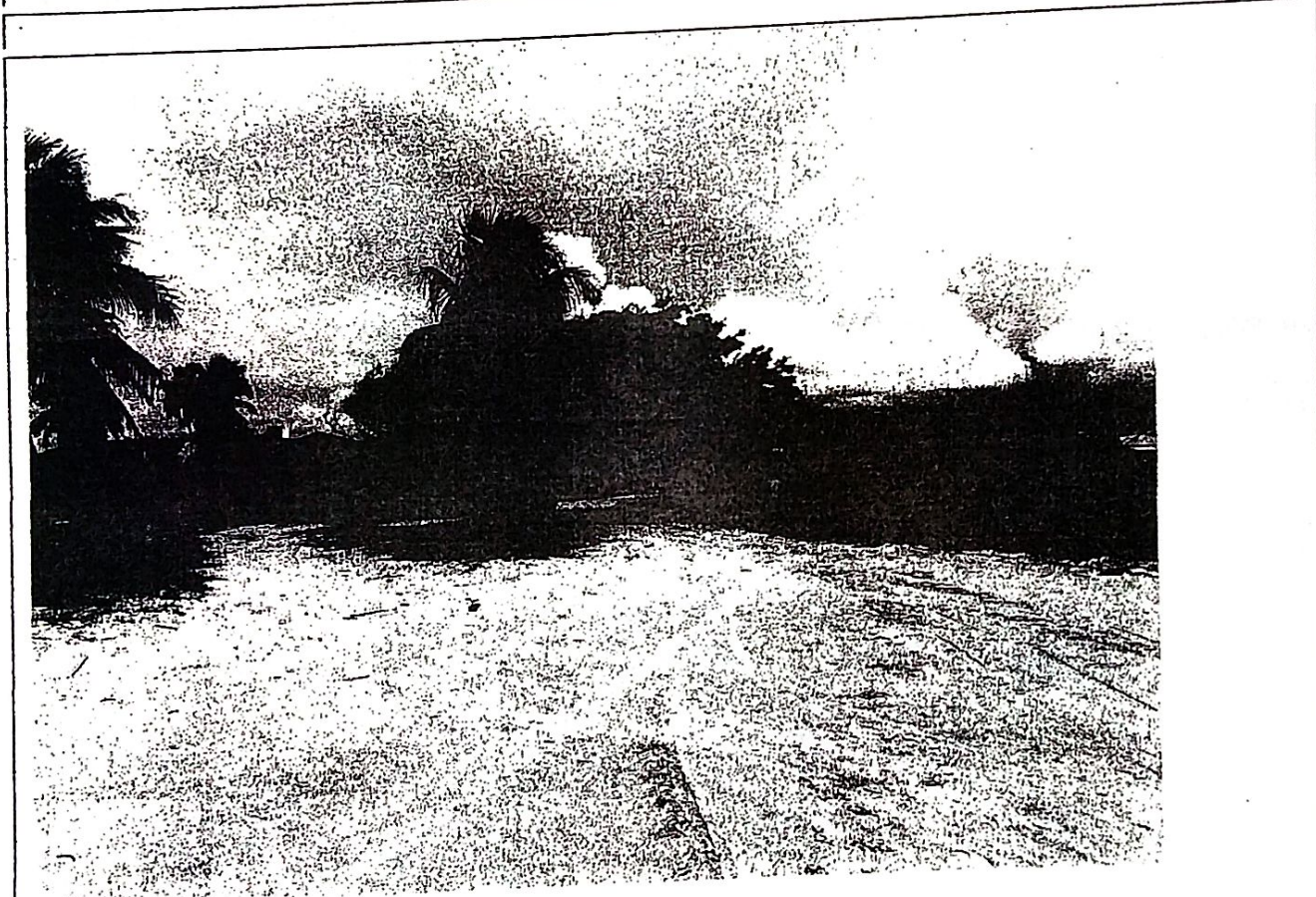
Foto 1: Vista parcial do lote, observa-se a forma do relevo de superfície plana, o solo de característica areno-argiloso com siltes e a vegetação típica de tabuleiro, de porte arbustivo e arbóreo.