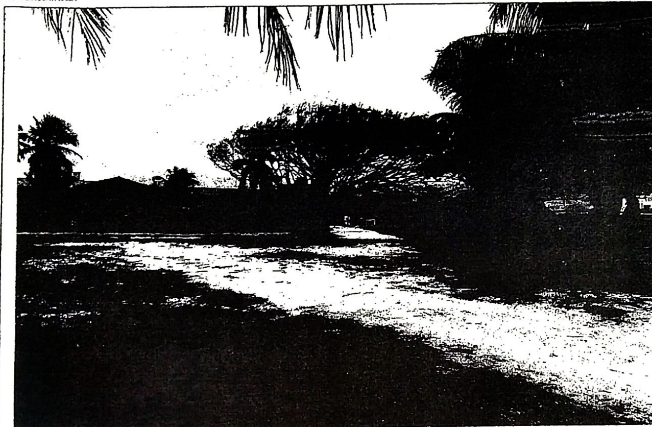
Foto 2: Aspecto geral do lotes, vegetação composta por gramíneas salsa, vegetação típica de tabuleiro.