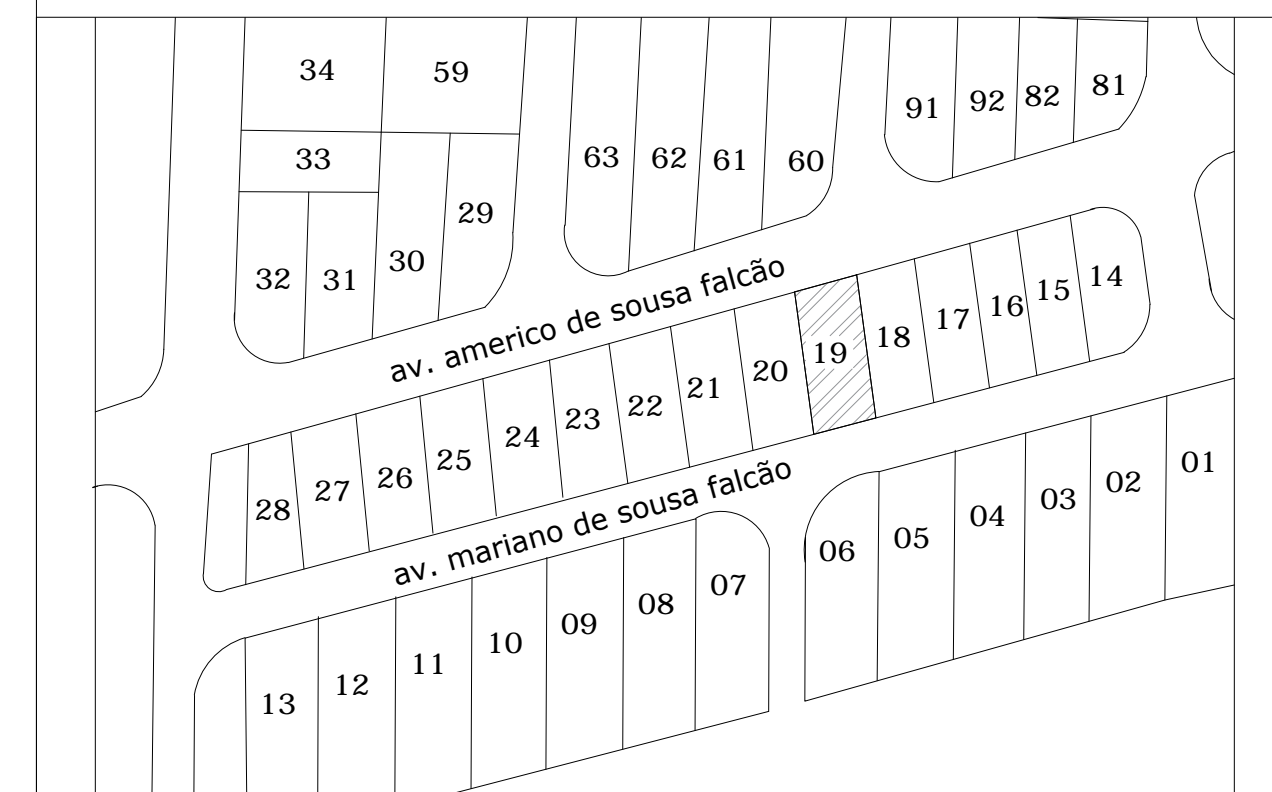
PLANTA DE LOCALIZAÇÃO ESCALA 1/750

PROPRIETÁRIO: CAMILLA MARTINS SILVA E OUTROS CPF:017.393.002-62