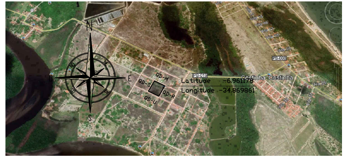
PLANTA DE LOCALIZAÇÃO SEM ESCALA

AREA "A" A SER DESMEMBRADA DA MAT. 10602 CRI LUCENA