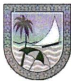
IMAGEM DO CADASTRO MERCANTIL